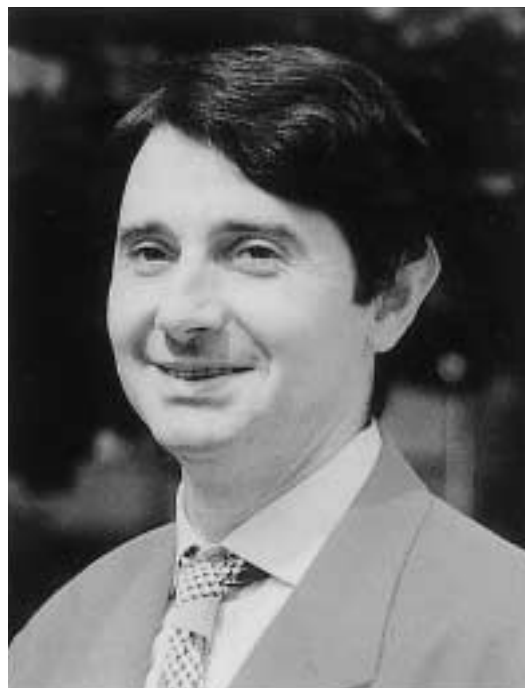
～ピーター フランクルさん～ (数学者・大道芸人)

1953年ハンガリーに生まれる。パリ大学で博士号を取得、ソ連科学アカデミーに招かれる。国際数学オリンピックで金メダルの獲得やサーカス芸人国家試験にも合格するという経歴を持つ。