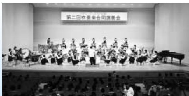
5月11日(日)に行われた、吹奏楽部合同演奏会

町では本年度、埼玉県教育委員会より「家庭・学校・地域ふれあい推進事業」の指定をうけ、5月7日に家庭・学校・地域の皆さんの代表の24名のかたを推進委員として委嘱し、推進委員会を発足しました。清掃活動や職場体験などをとおして、以前にも増して、家庭や地域の皆さんとともに健やか