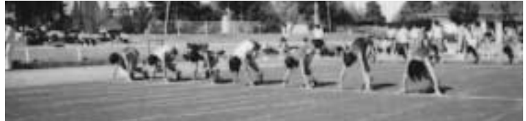
さわやか陸上競技会