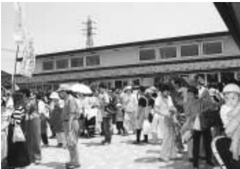
5月5日にオープンした「しらおか味彩センター」