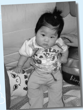
「パパとおふる大スキ♡」