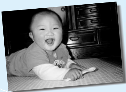
「ほくもアンパンマン...」