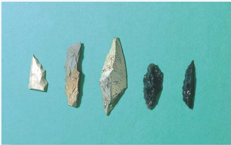
入耕地遺跡から出土したナイフ形石器 左側3点が凝灰岩系石材、右側2点が黒曜石で作られています。

本校は、平成7年度に開校し、9年目を迎えました。本年度のめざす学校像として、 ・児童が能力やよさを発揮し、居がいのある学校 ・みんな仲良く、生命と人権が守られている学校 ・静かで美しく、歌声が響きあい、秩序ある学校 を掲げ、28名の教職員が、全ての児童にとって心豊かに自己の能力を最大限に発揮し、自ら学び、考え、充実した学校生活を送れるよう、教科学習や体験活動、縦割り班活動、地域との交流活動等に取り組んでいます。