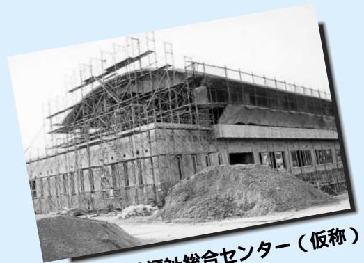
白岡町保健福祉総合センター(仮称)