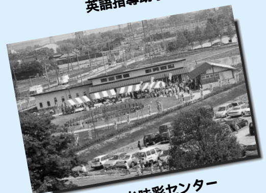
しらおか味彩センター