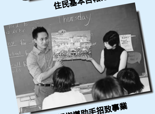
英語指導助手招致事業