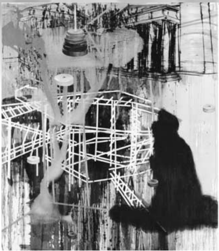
昌美さんの作品「UNTITLED」 (2002年に制作した作品で縦2800mm×横2400mm の大きな作品)