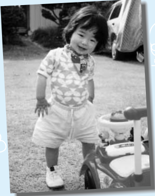
「おとなしそうに見えるけど、 違うんだよ!!」