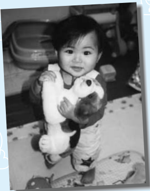
「ぬいぐるみも 本物のワンワンも大好き!」