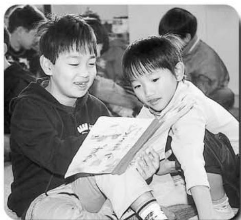
「上手にかけてるね。絵もきれいだよ。」

ぼくは絵本が好きで、家でもよく見ます。図鑑を作るのは難しかったけれど、絵がうまくかけました。すごくきれいに出来たよ。みんなに見てほしいな。