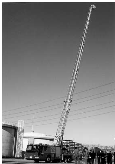
はしごは、約41mまで伸ばすことができます。