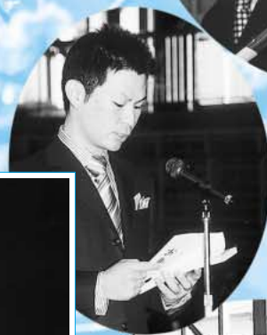
町長、教育委員長へのお礼の言葉

成人式を迎えることができ、うれしさと感謝の気持ちでいっぱいです。いつまでも思いやりを忘れないでいたいです。