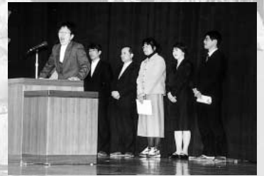
恩師からお祝いの言葉が