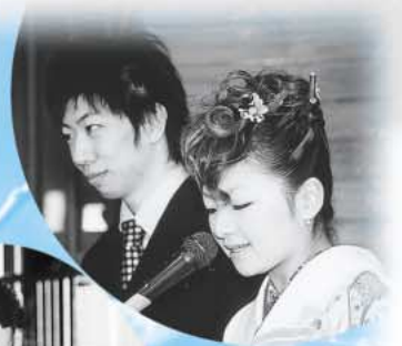
司会も務めました。