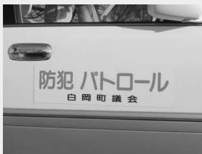
議員の自家用車にもステッカー

今回は議会といっしょに公用車にもステッカーを貼り、職員が用務で出かける際は意識的に学校周辺を走るようにするなど、町をあげて、防犯の呼びかけを行っています。