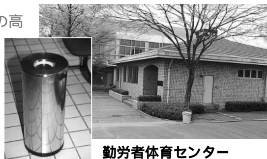
勤労者体育センター

勤労者体育センターにつきましても、受動喫煙を防止するために、5月1日から館内全面禁煙となりました。