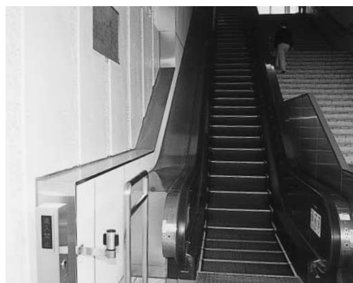
白岡駅エスカレーター

上り利用者にはご迷惑をおかけしておりますが、切り替え時間につきましては、しばらく利用状況を見守りたいと考えております。