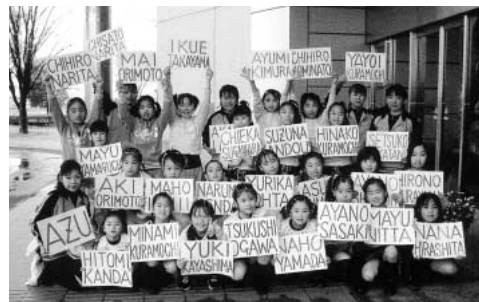
アズ カンパニーのメンバー