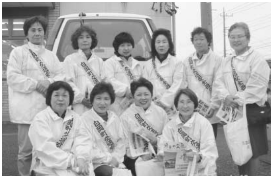
4月13日、新白岡地内で街頭指導を行いました