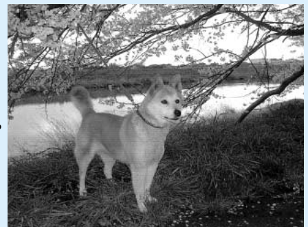
「桜の花を背にハイポーズ」

皆さんのお家で「こんなにきれいに花が咲いた」「うちのペットを見て」「うちの家族のここがすごい」など、みんなにお知らせしたい、自慢したい、などと思っていることを紹介します。ジャンルは問いません。ぜひ投稿してください。ただし、営利目的のものなど、広報紙にふさわしくないものについては掲載できない場合もあります。投稿をお待ちしています 住所、氏名、電話番号を明記し、写真にコメントを添えて、お送りください。