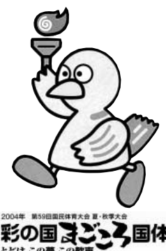
2004年 第59回国民体育大会 夏・秋季大会 彩の国まごころ国体 とどけ この夢 この歌

すべての人に 人間の尊厳を 5月は赤十字運動月間です。赤十字の事業は皆さんから寄せられた事業資金(社費)により行なわれています。 日本赤十字社は、赤十字の理念である人道にもとづいて、さまざまな事業を実施しています。 この人道的事業は、一般のかたから寄せられた資金でまかなわれています。 この資金は、赤十字社員のかたから寄せられた社費と社員以外の皆さんから寄せられた寄付金とに分けられています。 今年もご協力お願いします。 問合せ先 日本赤十字社埼玉支部白岡町 分区分 福祉課社会福祉係 内線 168