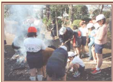
子どもたちが楽しみにしている「焼きいも集会」

五月、躑躅、櫻、八つ手、雪柳、ちよっと足を延ばせば、胡桃、李、無花果、銀杏、珊瑚樹、橘、南天、桜桃、ドラセナ、ポプラ...等々。これらの木々の間を、子どもたちは可愛い声をあげながら走り回ります。また、雀、椋鳥、白鶺鴒、尾長、百舌、鶇鳥、目白、(鶇もいたとか?)たちも負けずに大山庭園の中を散策し、至福の時を過して巣に帰るのです。小鳥たちにとって大山庭園は楽園なのでしょう。時には、ご近所のお年寄りたちもお花見に訪れてくださいます。秋になると、緑色の庭園から一変し、葉が色染まり錦織りなす様は、絵画のごとく美しい世界をつくります。やがて櫻の葉が落葉した後は、子どもたちが楽しみにしている「焼きいも集会」が待っています。櫻の葉が燃え尽きその白灰の中から素朴な甘い香りが大山庭園に広がる瞬間、子どもたちの歓声があがるのです。まさに大山庭園冬の風物詩がここにあります。 ぜひ大山庭園にお越しください!