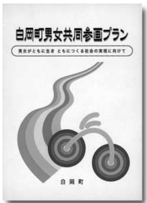
庁舎1階アトリウム、公民館、図書館などで閲覧できます。

こうした状況や、これまでの施策等を踏まえて、新たな課題や取り組むべき施策の方向性を明らかにし、男女共同参画社会形成への施策を計画的に推進するため、新たに「白岡町男女共同参画プラン」を策定しました。