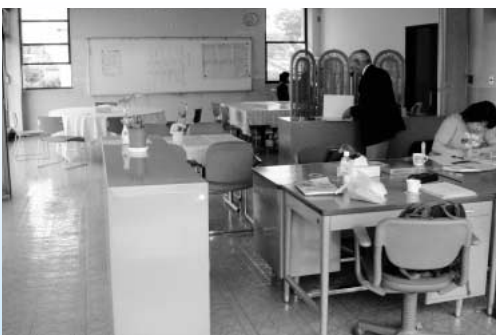
教育支援センター

当センターの開設時間は月曜日から金曜日(祝日・長期休業日の一部を除く)の午前9時30分から午後3時です。