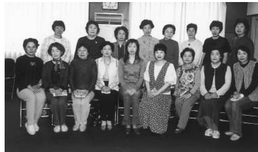
コーラスさくら草のメンバー