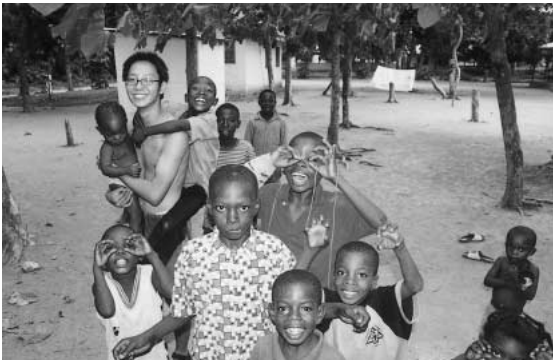
笑顔の絶えない、ガーナの子どもたちと