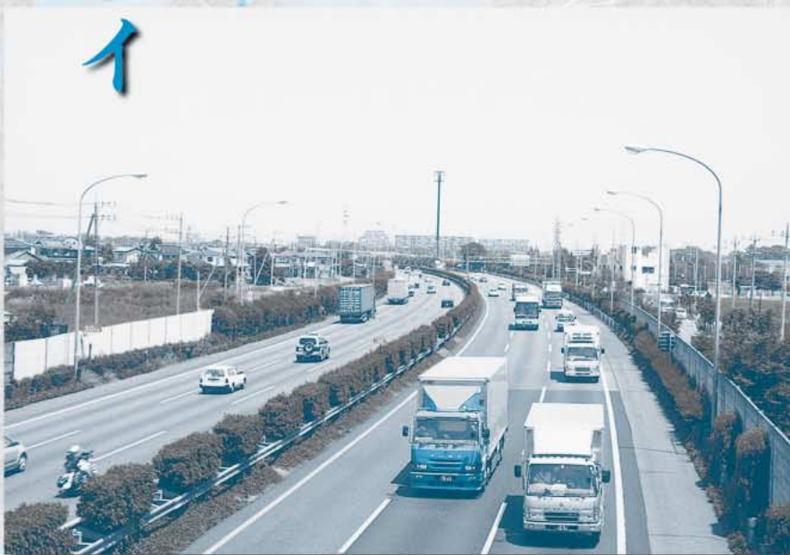
現在の東北自動車道