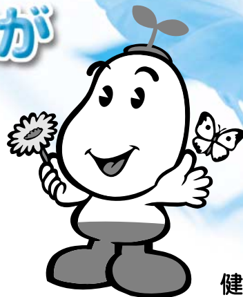
国保マスコット 健康まるくん

国民健康保険の被保険者のかた、または老人保健受給者のかたで、住民税非課税世帯（表1）のかたが入院したときは、入院時の食事代や高齢者の一部負担金が減額される制度があります。