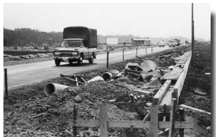
昭和42年 県道大宮・栗橋線開通（現さいたま・栗橋線） 同年開催の埼玉国体に合わせて造られました。この周辺は10年後に西地区の住宅用地として整備されました。