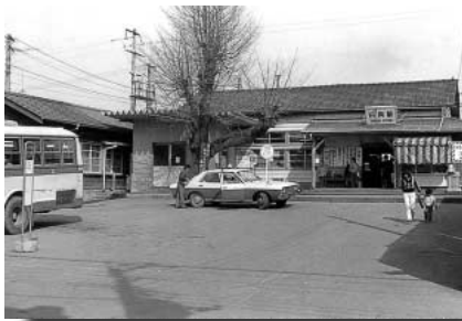
昭和50年当時の白岡駅