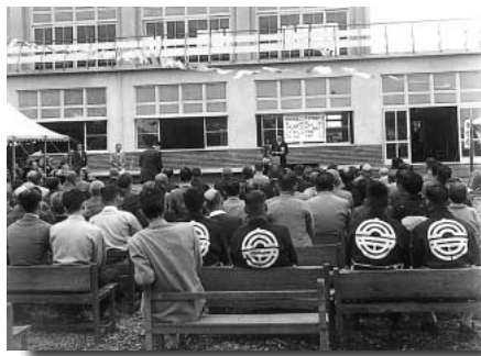
昭和31年 庁舎落成式 庁舎の南側で9月29日に行われました。

3月15日には、それまでかなりの応募があったにもかかわらず再度、図案募集を行なうなど、かなりの熱の入れようでした。