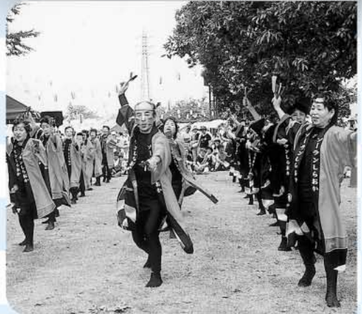
今年初登場のよさこいソーランおどり