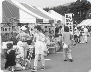
利根広域物産展では、16市町村の特産品を即売