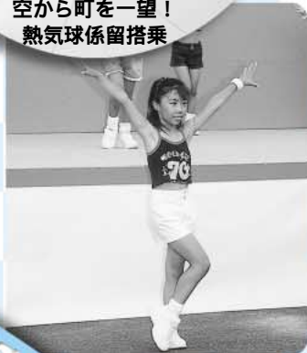
ジャズダンスをはじめ、 さまざまな催しが行われた 第1ステージ