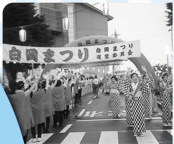
約1,000人のかたが参加！ 白岡おどり