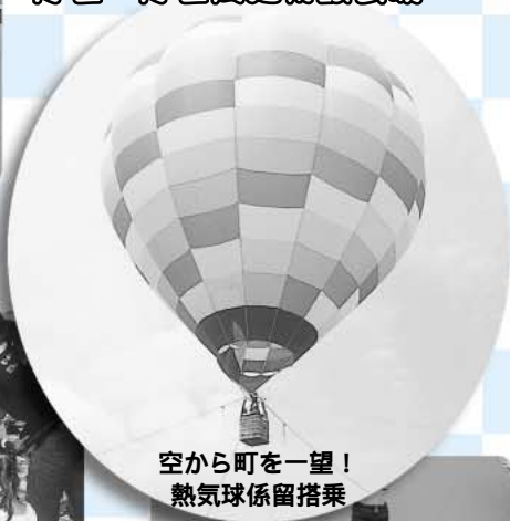
空から町を一望！ 熱気球係留搭乗