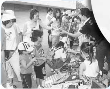
おおぜいのお客さんでにぎわったフリーマーケット