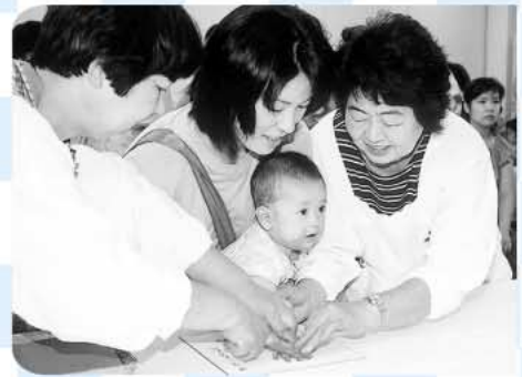
毎年大人気の赤ちゃん広場