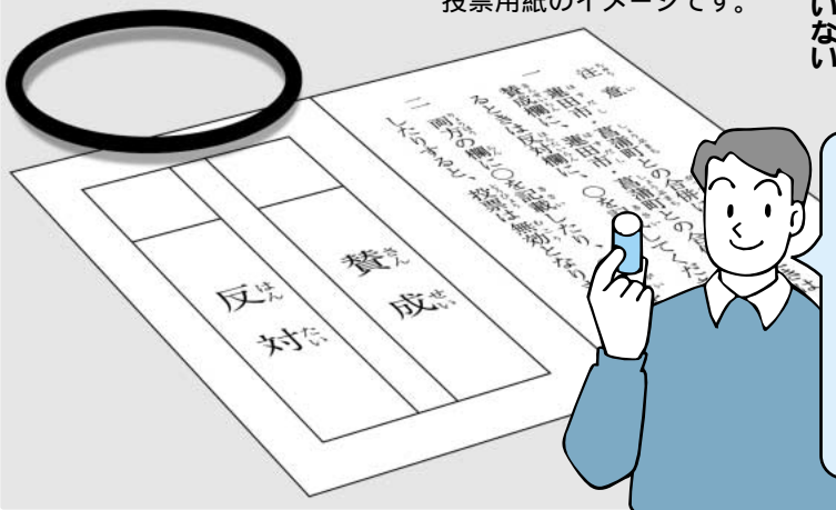
投票用紙のイメージです。

白岡町が、蓮田市、菖蒲町と合併することについて、「賛成」「反対」のいずれの欄に「○」を記載してください。「○」の印を押すスタンプは、投票所に用意してあります。「×」印など記載したものなどは無効となりますので、ご注意ください。