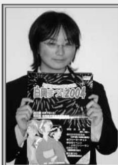
白岡まつりポスター制作者