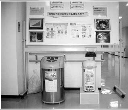
消滅型生ごみ処理機の展示