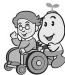
国保マスコット 健康まもるくん