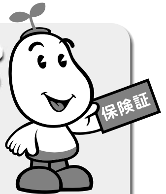
国保マスコット 健康まもるくん