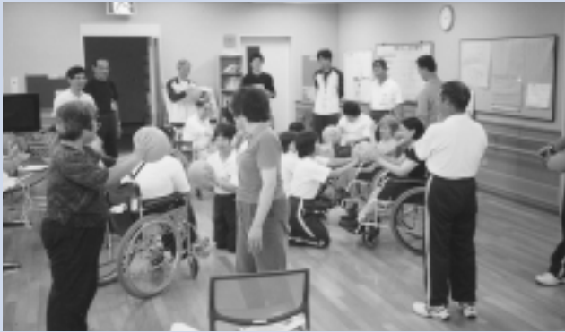
体育指導委員の活動状況

平成18年11月16・17日の2日間にわたり、「第47回全国体育指導委員研究協議会」が大分県別府市において開催されました。開会式に続く表彰式では、長年にわたり、スポーツに関する教室の企画・運営、ニユースポーツの普及など幅広い活動内容が評価され、埼玉県71市町村を代表し、白岡町体育指導委員連絡協議会が、名誉ある「全国優良団体表彰」を受賞しました。 今後も、体育指導委員の活躍にご期待ください。