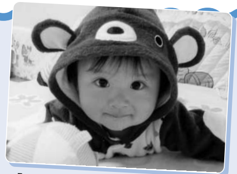
「早くハイハイできるといいな!!」