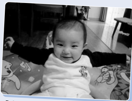
「カメラ目線は得意です！ 社長ポーズがお気に入り」