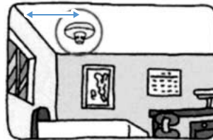
寝室 壁から60cm以上離す